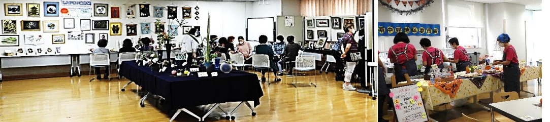
書道、絵手紙、折り紙、シャドウボックス、いけ花、作品展 軽食、南中野ボランティアコーナーPR、南中野町会連合会PR

○3日(日) 11時～14時 ☆ 焼きそば販売 ☆ 炊出し訓練 (日赤南中野分団) 会場:1階ピロティ